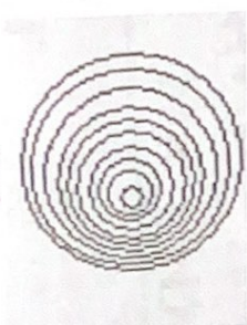
Рис. 2 1 Ответ: 10